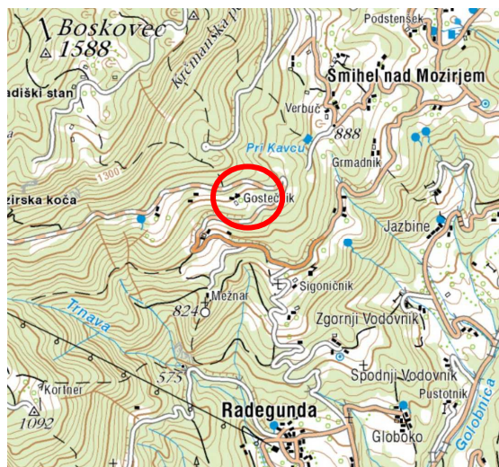
Slika 2: širši prikaz v prostoru – topografija (vir: www.geopedia.si )