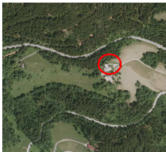
Slika 3: širši prikaz v prostoru – digitalni ortofoto posnetek