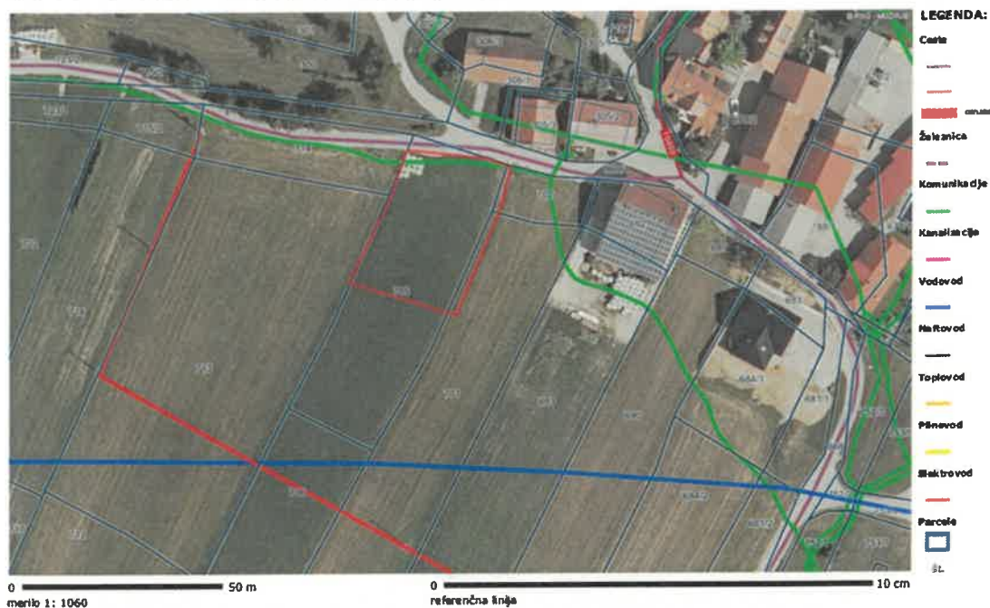
Slika 3: Prikaz območja LP in gospodarske javne infrastrukture.

Gospodarska infrastruktura (GJI) > Skupen prikaz (Promet, En, Ko, Ek)