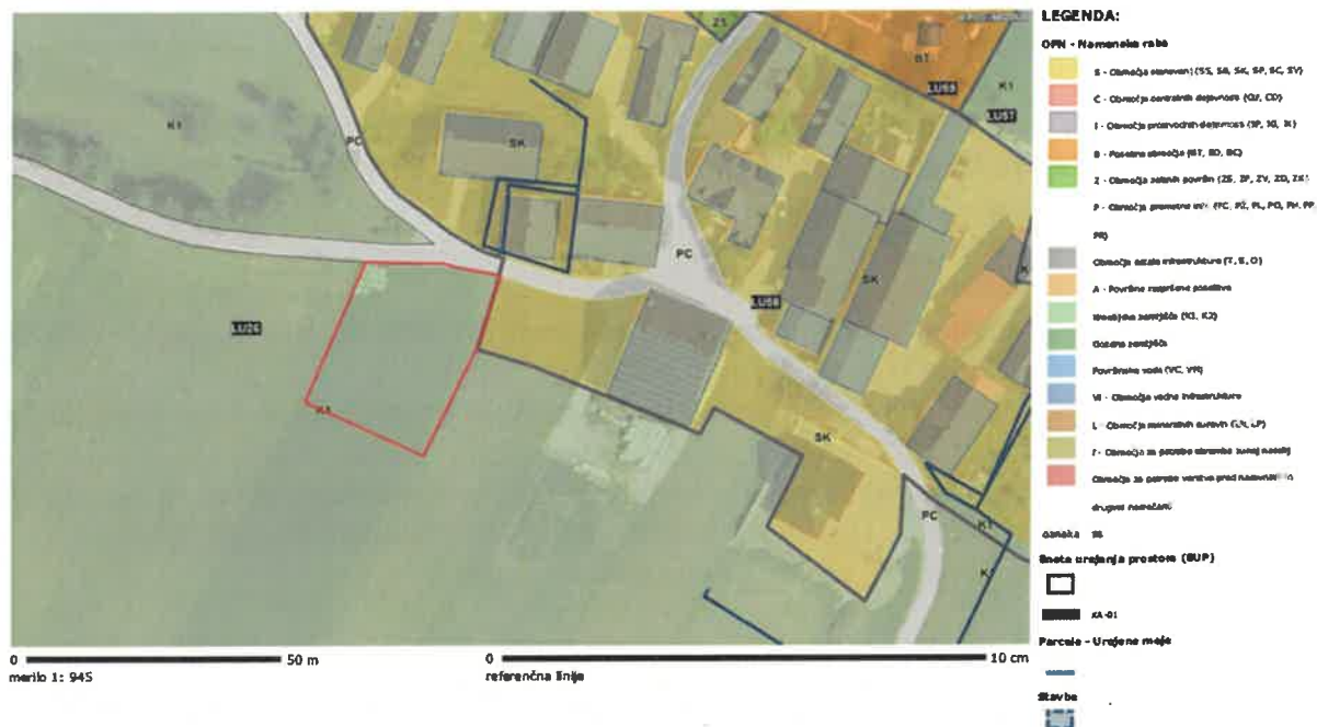
Slika 1: Prikaz območja LP na izseku iz občinskega prostorskega akta s prikazano namensko rabo.

Občinski prostorski načrt - OPN SD1 > Namenska raba