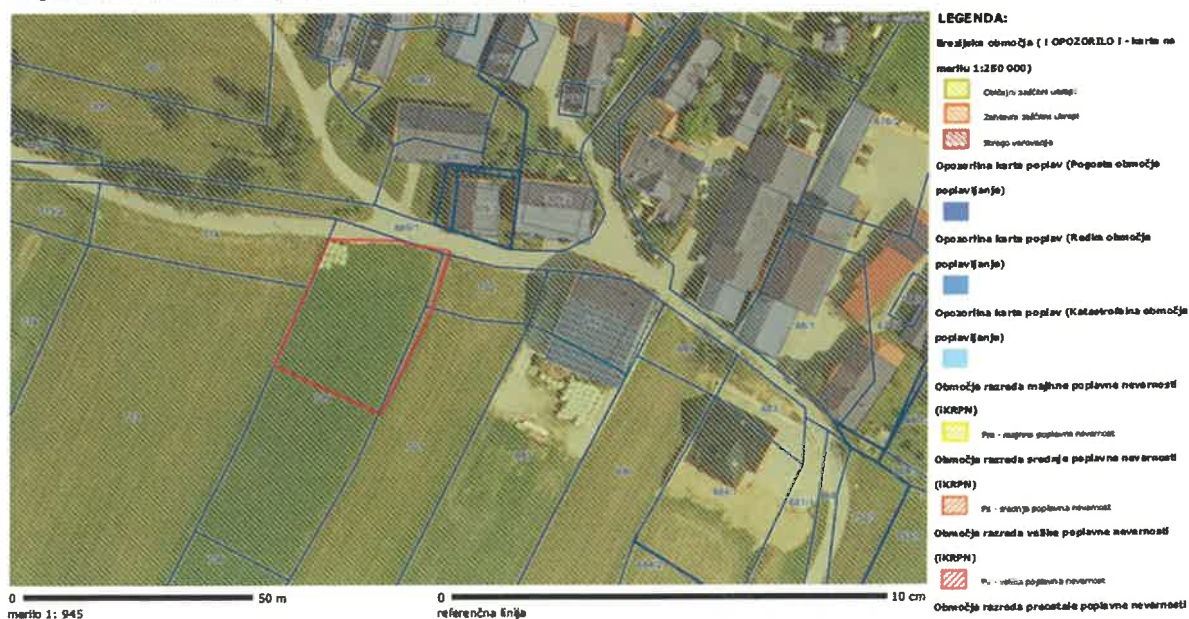
Slika 2: Prikaz območja LP z razredi poplavne nevarnosti.

Druge državne vsebine > Vode (hidrografija) > Poplave in poplavljeni dogodki